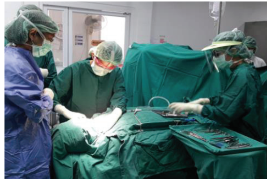
ภาพประกอบ 4 ผ่าคลุมรูนปีกผ้าเสริมโครงด้วยไม้ชนิดแข็งและเสริมสปริงด้านข้างปีก

ผ้าคลุมรูนนี้มีการเพิ่มเติมสปริงดึงเสริมด้านข้างปีกผ้าทั้ง 2 ด้าน เพื่อช่วยดึงให้ปีกผ้ากางออกในตำแหน่งและทิศทางที่เหมาะสม สปริงถูกยึดด้วยตะขอจุดละ 2 ตัว บน-ล่าง มีการติดสปริง 4 ตัวเพื่อเสริมแรง ถูช่องเก็บเครื่องมือยังคงไว้เหมือนเดิม