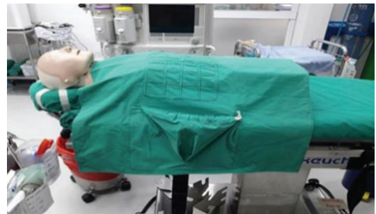
ภาพประกอบ 1 นวัตกรรมต้นแบบรุ่นโครงถุงผ้าเปิดอ้าเพื่อรองรับเครื่องมือที่ตก

ลื่นไหลตก และมีถุงที่สามารถเปิดอ้ารับเครื่องมือที่ตก โดยมีโครงลวดชนิดหนาสอดเข้าช่องขอบถุงผ้าเพื่อให้สามารถจัดโครงให้เปิดอ้าตามต้องการ ปัญหาที่พบคือการติดตำแหน่งถุงผ้าอยู่บริเวณเอวหรือตัวของทันตแพทย์ผ่าตัดทำให้เวลาปฏิบัติงานทับโครงปากถุงผ้าไม่ให้อ้าออกรับเครื่องมือและหากปรับถุงผ้าให้สูงขึ้นโครงปากถุงผ้าที่อ้าจะกีดขวางการปฏิบัติงานได้