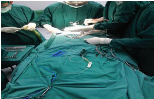
ภาพประกอบ 3 รูปผ้าคลุมรูนปีกผ้าเสริมโครงด้วยไม้ชนิดแข็ง

มีการออกแบบเพิ่มเติมคือ ทำช่องสำหรับใส่ไม้ชนิดแข็งตัดให้พอดีกับช่องผ้าที่ทำปีกมีกระดุมสแตนเลสขนาดใหญ่แบบกด ดัดไว้สำหรับปิดเปิดได้ สามารถนำไม้ออกมาทำความสะอาด อีกทั้งได้ออกแบบช่องเก็บเครื่องมือ สายจี้ไฟฟ้า สายฉีดน้ำเกลือไว้ 2 ช่อง เพื่อความเป็นระเบียบ สายต่างๆ ไม่พันกันหรือห้อยย้อยตก แต่พบปัญหาปีกผ้าเสริมโครงไม้ไม่สามารถตั้งขึ้นในตำแหน่งที่ต้องการ มีการพับเข้าด้านในและด้านนอก ต้องคอยจัดตำแหน่งตลอด