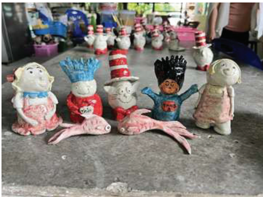
Figure 1 The Cat in the Hat” Ceramic