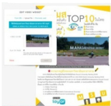
ภาพประกอบ 2 ขั้นตอนการพัฒนาสื่อ ผสานความจริงเสริม