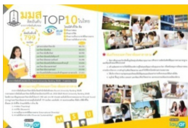
ภาพประกอบ 1 ขั้นตอนการพัฒนาสื่อสิ่งพิมพ์

1. การพัฒนาสื่อสิ่งพิมพ์ ผสานความจริงเสริม ผู้วิจัยได้จัดเตรียมทรัพยากรที่ใช้ในการพัฒนาสื่อสิ่งพิมพ์ ผสานความจริงเสริม และดำเนินการผลิตสื่อตามรูปแบบที่ได้ศึกษา