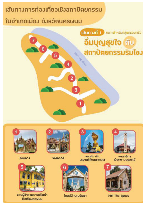
ภาพประกอบ 1 เส้นทางท่องเที่ยวอิมมูญสุขใจกับสถาปัตยกรรมริมโขง (กลุ่มนักท่องเที่ยวแบบครอบครัว)

โดยเส้นทางที่กล่าวมาข้างต้นเป็น เส้นทางที่เหมาะสมกับนักท่องเที่ยวกลุ่มครอบครัว เนื่องจากนักท่องเที่ยวกลุ่มนี้จะมีการเดินทางท่องเที่ยวเกี่ยวกับคนสนิทหรือญาติมิตรเพื่อใช้เวลา ท่องเที่ยวพักผ่อนร่วมกัน รวมถึงการทำบุญ ในสถานที่สำคัญทางศาสนา ซึ่งจากการศึกษา พฤติกรรมของนักท่องเที่ยวดังกล่าวพบว่า นักท่องเที่ยวกลุ่มนี้ไม่ต้องการใช้เงินในการเข้า เยี่ยมชมสถานที่ท่องเที่ยวและต้องการสถานที่ ท่องเที่ยวที่สามารถเดินทางเข้าถึงง่าย มีสถานที่ กว้างขวาง ไม่แออัด ดังนั้นคณะผู้วิจัยจึง ได้ออกแบบเส้นทางท่องเที่ยวอิมมูญสุขใจกับ สถาปัตยกรรมริมโขงสำหรับกลุ่มครอบครัว โดย พิจารณาข้อมูลจากระดับรายได้ ลักษณะของ การท่องเที่ยว และปัจจัยอื่นๆ ที่มีความเกี่ยวข้อง อยละเอียดดังภาพประกอบ 1