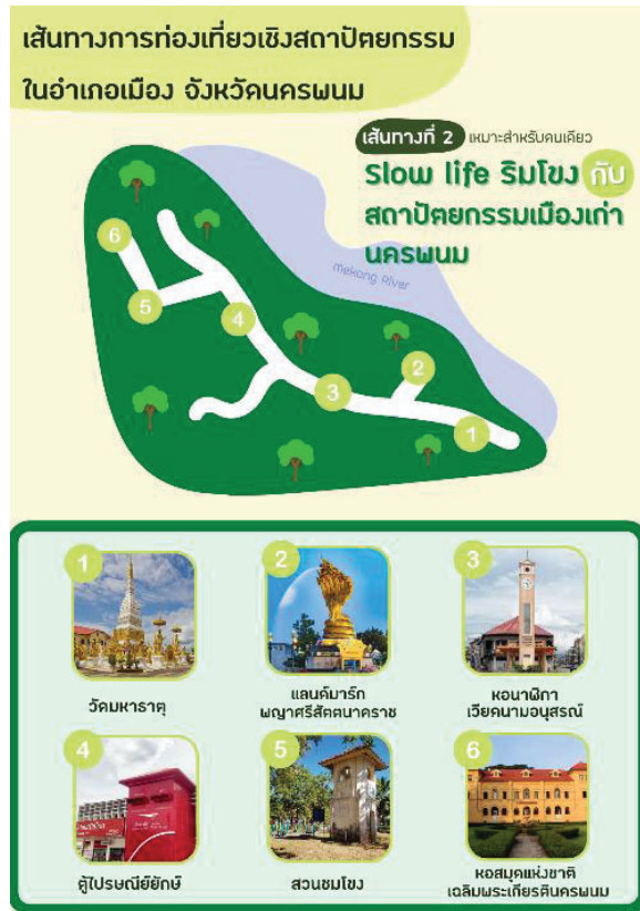
ภาพประกอบ 2 เส้นทางท่องเที่ยว Slow life ริมน้ำโขงกับสถาปัตยกรรมเมืองแก่นนครพนม (กลุ่มนักท่องเที่ยวแบบคนเดียว)

เส้นทางที่ 3 เส้นทางท่องเที่ยว Back to the past in Nakhon Phanom City (กลุ่มเพื่อน/คู่รัก) โดยคณะผู้วิจัยได้เลือกประเภทสถานที่ท่องเที่ยวเชิงสถาปัตยกรรมให้เหมาะสมกับพฤติกรรมของนักท่องเที่ยวกลุ่มเพื่อน/คู่รัก โดยมีสถานที่ท่องเที่ยวดังนี้ 1) พิพิธภัณฑ์ปลาลุ่มน้ำโขง เป็นสถานที่จัดแสดงพันธุ์ปลาน้ำจืดที่อาศัยอยู่ในแม่น้ำโขง และแม่น้ำในจังหวัดนครพนม ทั้งสายพันธุ์ที่พบได้ทั่วไปและสายพันธุ์ที่หายาก โดยไฮไลท์ของที่นี้อยู่ที่อุโมงค์จำลองโลกใต้น้ำที่สามารถชมปลามากมายแหวกว่ายไปมาผ่านกระจกบริเวณผนังและเพดานของ