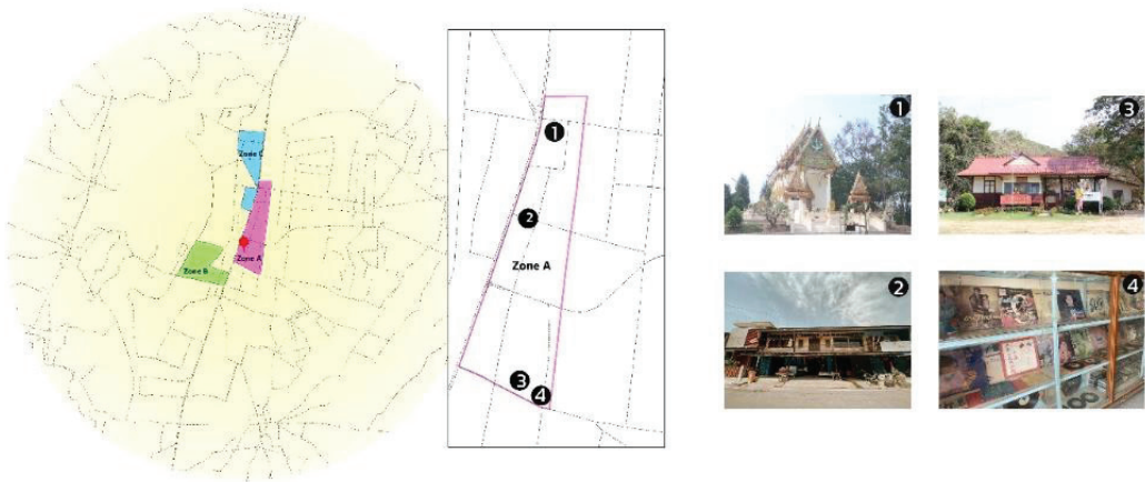
ภาพประกอบ 2 ลักษณะกายภาพขอบเขตพื้นที่ A (Zone A)