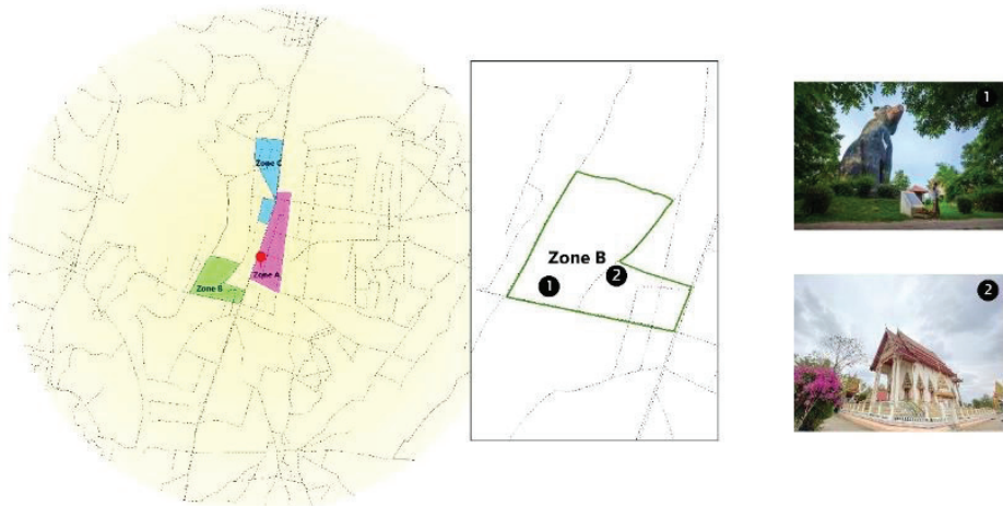
ภาพประกอบ 3 ลักษณะกายภาพขอบเขตพื้นที่ B (Zone B)