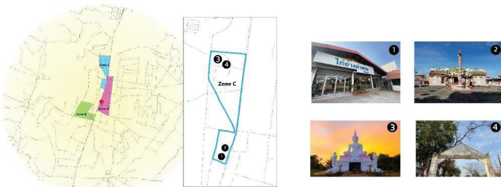
ภาพประกอบ 4 ลักษณะกายภาพขอบเขตพื้นที่ C (Zone C)