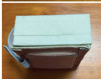
Figure 3 Artificial injection patch