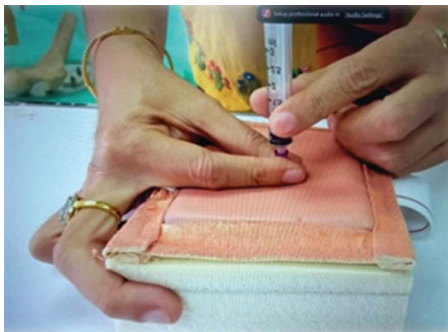
Figure 5 Orientation demonstration of the self learner box set for learning

1. ประชุมวางแผนการดำเนินงาน ออกแบบการจัดการกระบวนการ/กำหนด วัตถุประสงค์/เลือก เครื่องมือ/กำหนดกลุ่ม เป้าหมายที่จะทดลองใช้