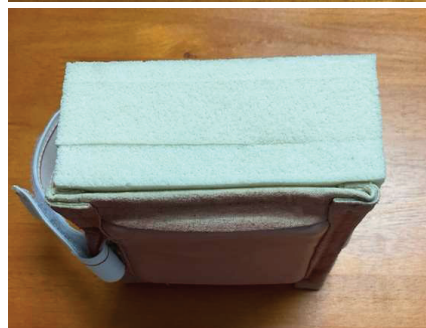
Figure 3 Artificial injection patch