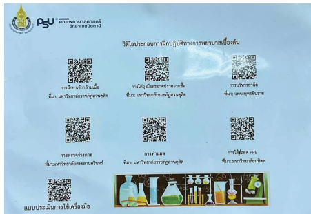
Figure 4 Video card for basic nursing practice