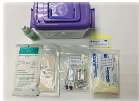
Figure 2 self learner box set

โครงการวิจัย การศึกษาผลการเรียนรู้การฝึกปฏิบัติการรายวิชาเทคนิคการพยาบาลผ่านชุดความรู้ self learner box set เพื่อขอรับการรับรองจากคณะกรรมการพิจารณาจริยธรรมการวิจัยในมนุษย์ของคณะพยาบาลศาสตร์วิทยาเขตปัตตานี มหาวิทยาลัยสงขลานครินทร์ เลขจริยธรรมหมายเลข NUR.PN0012/2022 ลงวันที่ 22 ธันวาคม 2565